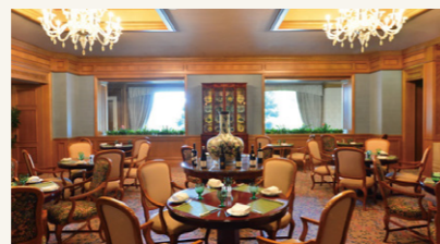
The Bistro | ザ・ビストロ