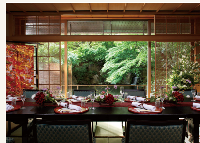
Ryotei Kinsui | 錦水