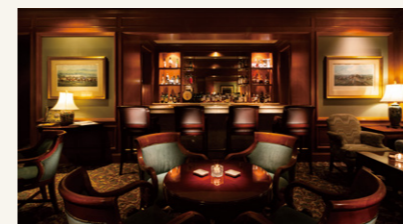
Le Marquis | ル・マーキー