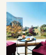
Foresta | フォレストア