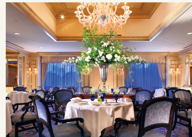
Il Teatro | イル・テアトロ