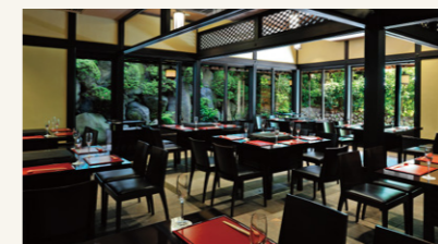
Mokushundo | 木春堂