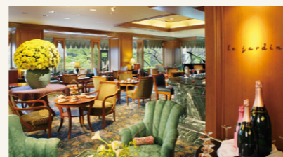
Le Jardin | ル・ジャルダン