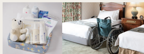
お子様向け専用アメニティ