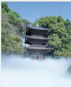
篁山竹林寺三重塔跡地を思わせる 「天空の三重塔」

Baron Fujita Heitaro searched all of Japan for a three-story pagoda that could stand upon the tree-lined hill. Now, a century after its relocation, that aesthetic vision remains deeply admired. At the former site of the pagoda at Takamurayama Chikurinji Temple in Higashi-Hiroshima, a sea of clouds can be witnessed under certain conditions. Now, that breathtaking view is recreated within Tokyo.