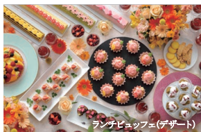
ランチビュッフェ(デザート)