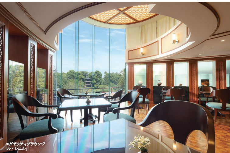
エグゼクティブラウンジ 「ル・シエル」