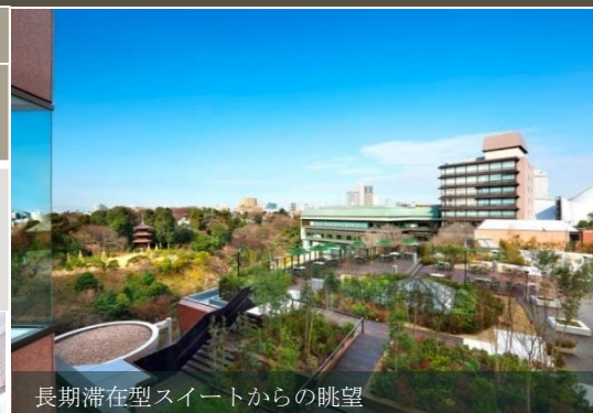
長期滞在型スイートからの眺望