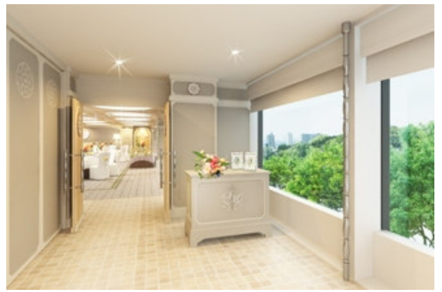
↑ソレイユ：前室（完成予想図）

ホテル椿山荘東京のウエディングコンセプトである、「Many Thanks Wedding～ふたりの感謝の気持ちをカタチに。～」そんな世界にたったひとつの結婚式をつくるため、私たちが心をこめてお手伝いします。