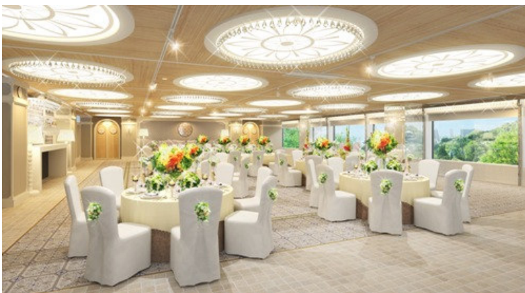
↑ソレイユ：披露宴会場（完成予想図）

オーナメントがきらきらと輝く太陽モチーフの照明をはじめ、既存の大きな窓、ミラー素材や光沢のあるタイルを用いた柱により、洗練された雰囲気の中、より一層の明るさが広がります。また、飾り棚のあるコンソールやオーナメントを吊り下げた天蓋、ゆったりとしたカウチを配し、カジュアル過ぎず、かつ親密で寛げる空間を演出します。スタイルソムリエが提案する、生演奏と美食のセッションにより、贅沢で和やかなひとときをお過ごしいただけます。