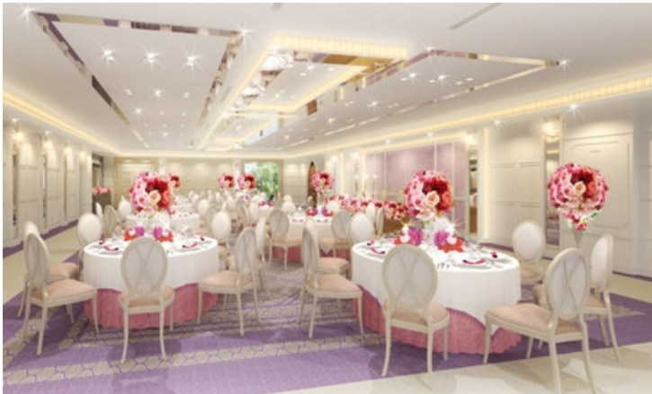
↑カシオペア：披露宴会場（完成予想図）

また、これらの空間は新郎新婦がシーンによって思い通りに使うことができます。専用廊下にふたりの思い出の品を飾る、“Welcome”の気持ちを伝える小物を配置する、ウッドデッキに出て緑のなかでゲストと記念撮影をするなど、大切なゲストをおもてなし、感謝の気持ちを伝えることができます。