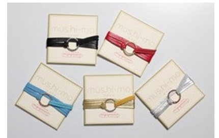
↑「mus. hi-mo (むすひも)」。5色のバリエーションがあり、それぞれ祓(はらい)を意味する森羅万象の「五行」と儒教の5つの道徳を掛け合わせた「五常」の意味合いが込められている。

※7月8日以降のブライダルフェア来館の方にも「mus. hi-mo (むすひも)」をプレゼントします