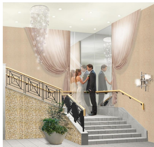
【上】回廊【下】チャペルへの階段(完成予想図)