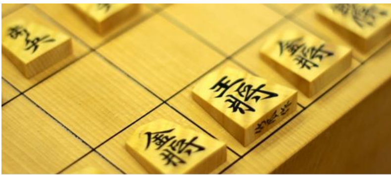
上段左：佐藤 天彦名人 上段右：羽生 善治竜王 下段：将棋イメージ