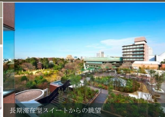
長期滞在型スイートからの眺望