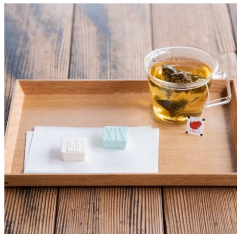
東京と京都で、椿茶と和三盆の おもてなしコラボレーション