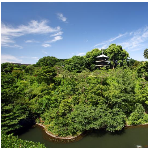
山縣有朋の本邸 ホテル椿山荘東京庭園 (東京)

～ G.W. に椿山荘のシンボルである椿のお茶と、京都の伝統和三盆でおもてなし ～