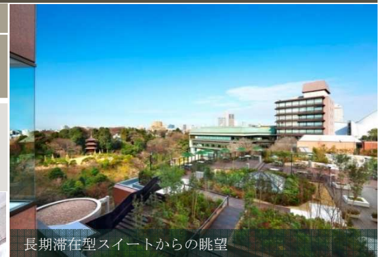
長期滞在型スイートからの眺望