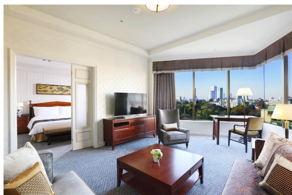
5 ヶ年計画で進めている客室改装