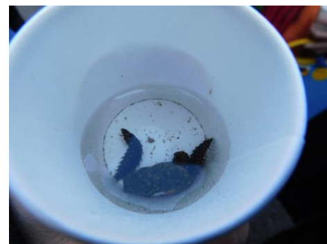
2017年「ほたるの幼虫の放流式」の様子

清らかな水辺でご覧いただけることで知られる蛍ですが、ホテル椿山荘東京には、秩父山系からの地下水が湧き出ています。また、2000年から専門家の指導の下、ゲンジボタルが産卵から飛翔まで、生息できる環境作りの一環で、ホテル庭園内を流れるせせらぎの水質・水量の改善や湧水の整備など、蛍やその餌のカワニナが生息できる環境作りに取り組んでおります。地下から流出する湧水を利用した飼育施設をホテル内に設置し、幼虫までの飼育を行っております。*蛍は、庭園や藤田観光グループ各施設で育つ飼育蛍です。